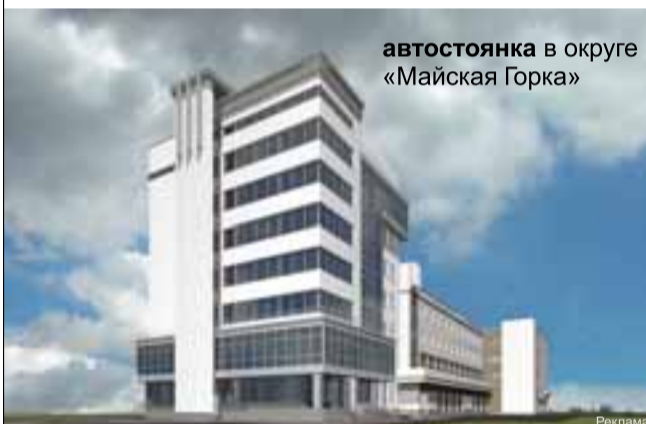
автостоянка в округе «Майская Горка»

Многоуровневая автостоянка с автосервисом и помещениями общественного назначения.