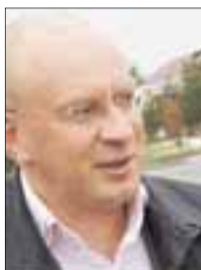
Игорь ФЁДОРОВ, губернатор Ненецкого автономного округа

- Уходит в прошлое 2010 год. У каждого из нас он сложился по-разному. Но в эти мгновения все мы вспоминаем о самых ярких и радостных его событиях.