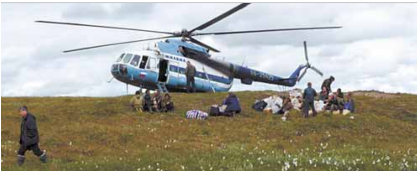
НАО подрезали крылья - субсидирование авиаперевозок в 2010 году из бюджета области намерены исключить.

Бюджет Архангельской области в 2009 году будет не исполнен на 1-1,5 млрд рублей. Поступления в бюджет сократились на 5 млрд рублей, причем значительной доли платежей казна недополучила от Ненецкого автономного округа. Из запланированных 5,6 млрд рублей от НАО до бюджета области по состоянию на 1 сентября дошло лишь 2,5 млрд. Нерадужны перспективы и 2010 года. Поэтому Правительство Архангельской области сокращает расходы на финансирование полномочий субъекта РФ на территории округа, ведь область тратит на НАО больше, чем получает от него.