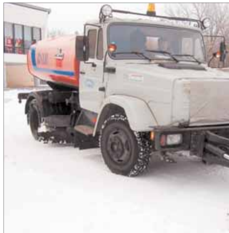
Госзаказ на снегоуборку в Архангельске делают два крупных предприятия. Остальные работают по субподряду.