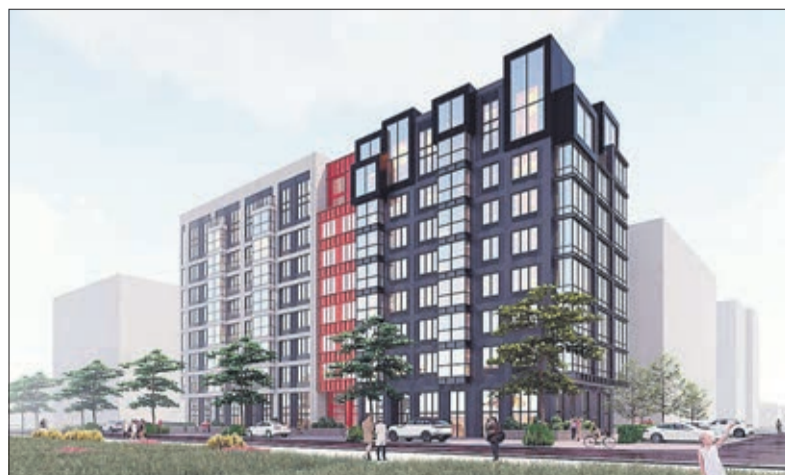
ЖК «КИНО» УДОБНО РАСПОЛОЖЕН НА ВЪЕЗДЕ В СОЛОМБАЛУ – НА УЛИЦЕ ВАЛЯВКИНА. ИЗ ОКОН ВЕРХНИХ ЭТАЖЕЙ БУДУТ ОТКРЫВАТЬСЯ НЕПОВТОРИМЫЕ ВИДЫ НА МОСТ И РЕКУ. СРОК СДАЧИ НОВОСТРОЙКИ – I КВАРТАЛ 2026 ГОДА.

Добавим, что проекты EDS group имеют запоминающуюся архитектуру и детали, которые создают комфорт, а также выверенные планировочные решения. Все дома, построенные компанией, становятся настоящим украшением города. В их числе – жилые комплексы «Наследие», «Дрозд», «Маленькая Италия», «Джаз», «Соло». В быстроразвивающемся округе Майская Горка EDS group возводит ЖК «Солярис»: здесь применён новый подход к проектированию. На крыше планируется создать террасы. А сам дом расположен таким образом, что солнце будет проникать в каждую квартиру и комнату и наполнять их светом.