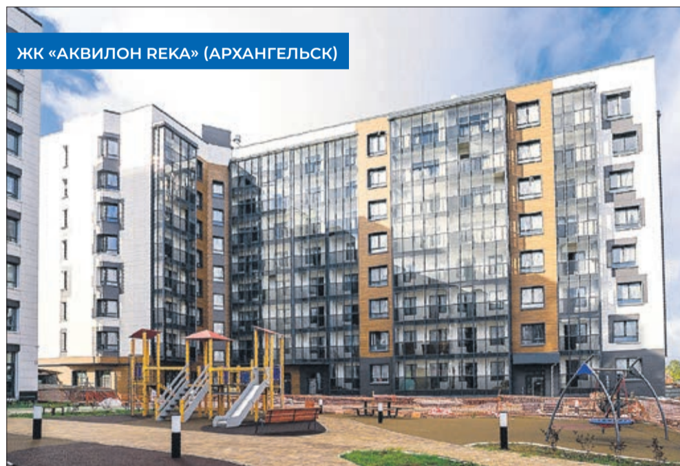
ЖК «АКВИЛОН РЕКА» (АРХАНГЕЛЬСК)

В феврале текущего года Совет директоров Группы Аквилон принял решение о создании нового подразделения – «Аквилон Регионы». Компания расширяет своё присутствие в регионах России и приступает к реализации новых проектов в Нижнем Новгороде,