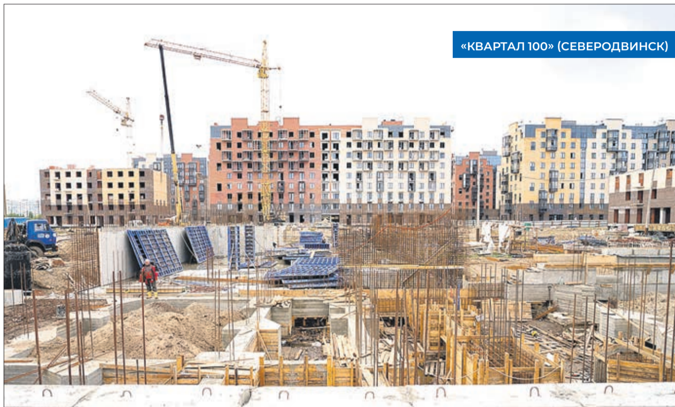
«КВАРТАЛ 100» (СЕВЕРОВДИНСК)

«Взяли квартиру в этом ЖК из-за планировки четырёхкомнатной квартиры. Когда жена увидела большую кухню и отдельную гар-