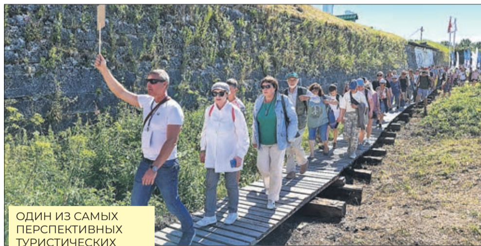
ОДИН ИЗ САМЫХ ПЕРСПЕКТИВНЫХ ТУРИСТИЧЕСКИХ ОБЪЕКТОВ АРХАНГЕЛЬСКА – НОВОДВИНСКАЯ КРЕПОСТЬ