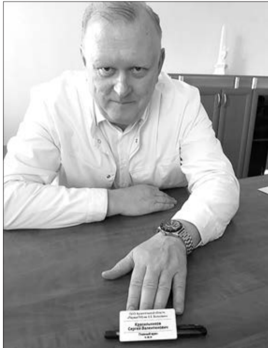
Эксклюзивное фото «БК»