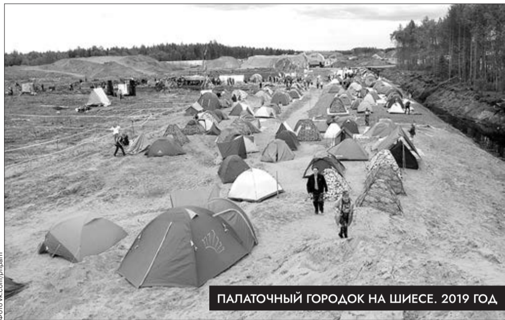
ПАЛАТОЧНЫЙ ГОРОДОК НА ШИЕСЕ. 2019 ГОД