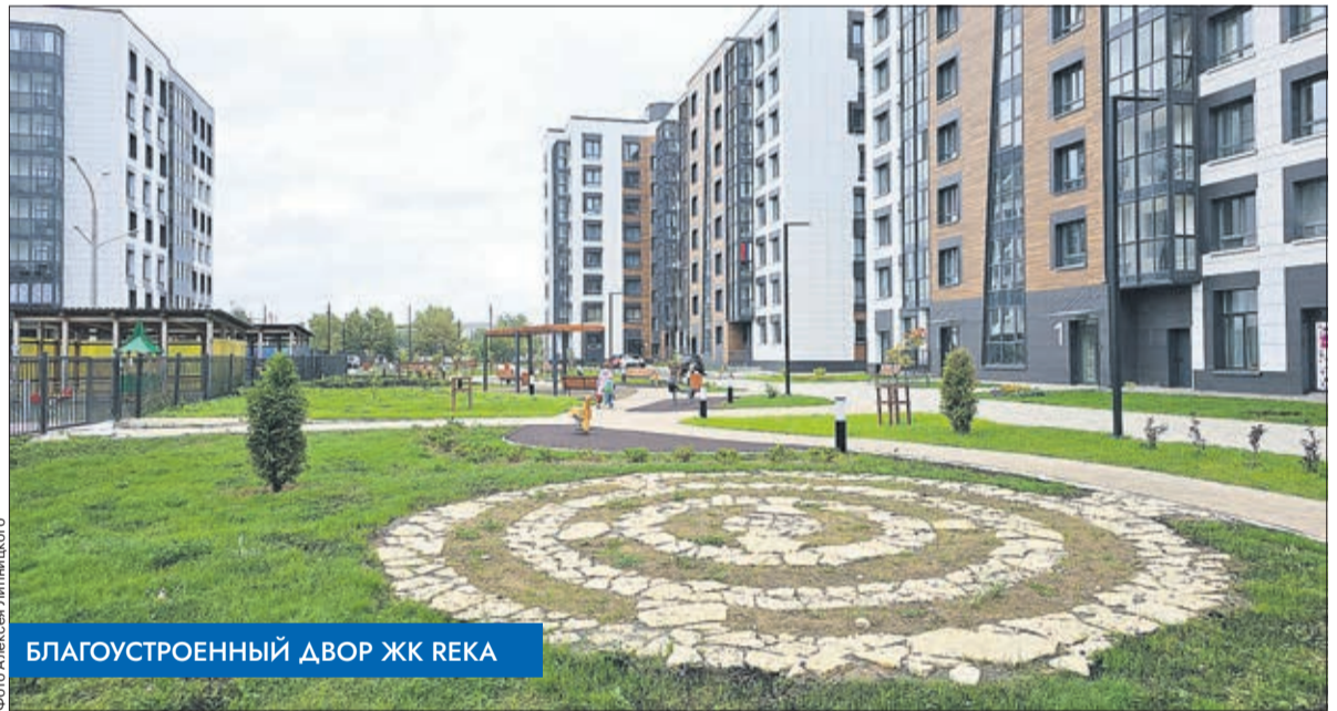
Благоустроенный двор ЖК REKA

Одни из самых «зелёных» проектов на текущий момент Группы Аквилон реализует в Архангельске и Северодвинске. Компания планирует обустроить в 15 новых комплексах двух городов 14,19 га и 13,12 га территорий с озеленением по 4,26 и 3,94 га соответственно. Самые крупные участки благоустройства – площадью около 6 га в жилом комплексе на набережной Северной Двины «Аквилон АКВАРТАЛ» в Архангельске и в «Квартале 100 by Akvilon» в Северодвинске, где площадь благоустройства составит свыше 5 га, озеленения – более 1,5 га. Кроме того, в квартале 100 ведётся строительство общедоступного парка