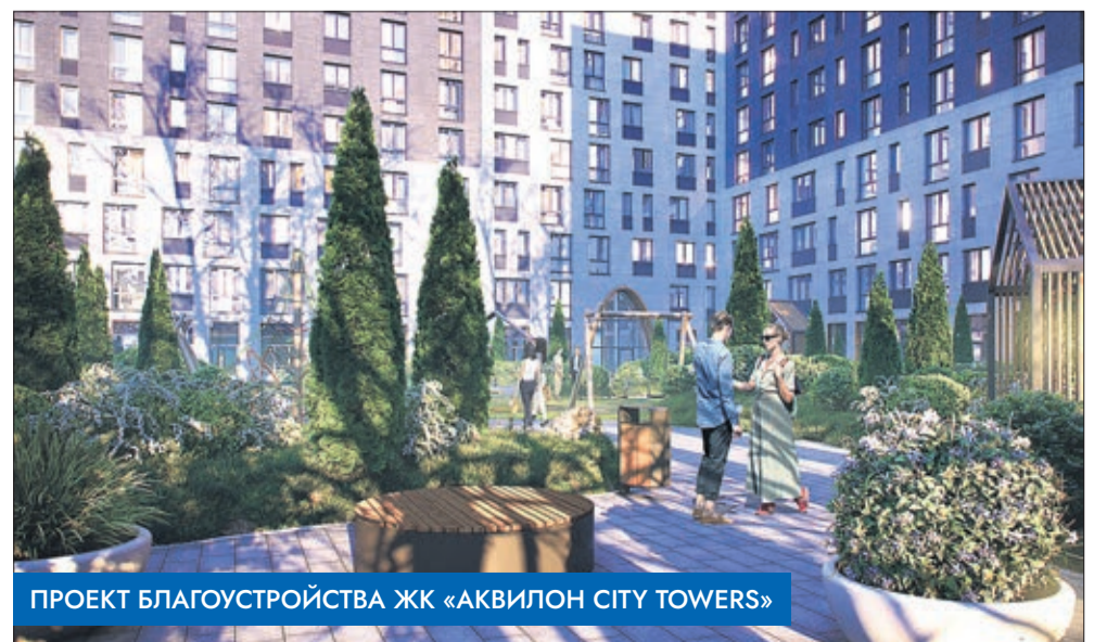
Проект благоустройства ЖК «Аквилон City Towers»