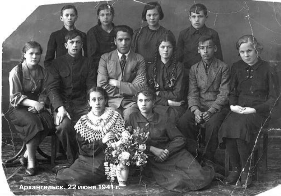
Архангельск, 22 июня 1941 г.

Сегодня невозможно понять, почему именно этот эпизод той страшной ночи был засекречен. Так или иначе, погибших курсантов тайно захоронили в братской могиле близ полевого лагеря, а сама трагедия оказалась забыта на десятилетия. Только в конце 1970-х – начале 1980-х родственники ребят и ветераны военно-инженерного училища при поддержке «Правды Севера» добились установки обелиска в Чёрном Яре – близ шоссе и на братской могиле. Ухаживали за ними служащие воинской части № 28108, которая была образована вскоре после войны как раз на месте полевого лагеря училища, откуда курсанты отправились в ту роковую ночь.