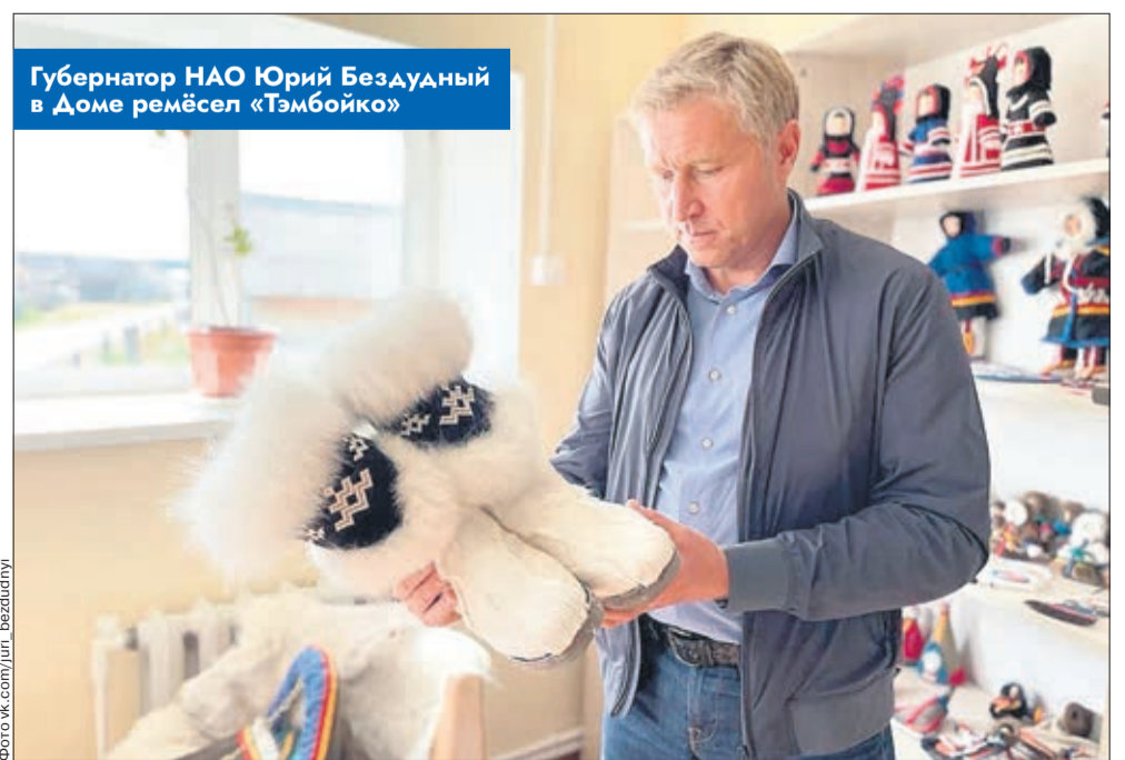
Губернатор НАО Юрий Бездудный в Доме ремёсел «Тэмбойко»