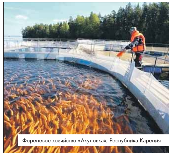
Форелевое хозяйство «Акуловка», Республика Карелия

«Специалисты же, не опровергая мои аргументы, даже не попытались привести свои. И содержание их ответа фактически звучит как самооправдание: «Это правильно, потому что мы это придумали». Как же ещё иначе можно трактовать следующий пассаж: «В случае внесения изменений в Правила (расчёта и взимания платы за пользование рыбоводными участками. – Прим. ред.) начальная цена предмета аукциона по Архангельской области составит 10% от указанной цены, и данное изменение может затронуть интересы пользователей, ра-