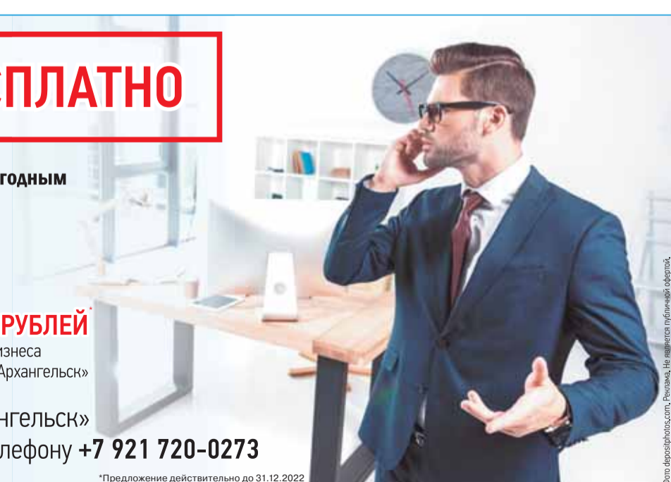
Ревизия, Не является публичной офертой.