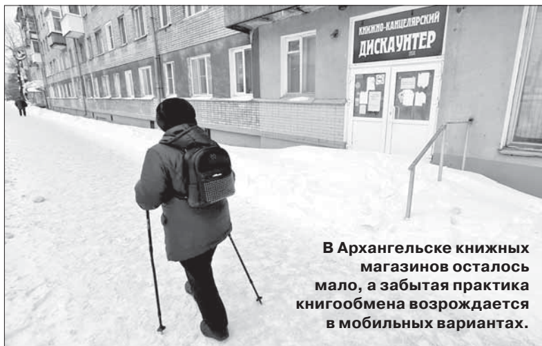
В Архангельске книжных магазинов осталось мало, а забытая практика книгообмена возрождается в мобильных вариантах.

дируем, превращаясь из самой читающей страны мира в «банановую республику»? Может быть, мир меняется, бумага уступает «цифре»? Наверное, все понемножку имеет место. Возможность не вставая из-за компьютера стать обладателем «книги», пусть и не пахнущей пылью прожитых ею лет или свежей типографской краской, прельщает многих, а ресурсы Интернета, в том числе бесплатные, постоянно расширяются. Спрос на бумажные книги, напротив, снижается, они перестают быть «товаром массового спроса», сохранять рентабельность торговли таким товаром становится все сложнее. И, к сожалению, да: читаем мы намного меньше.