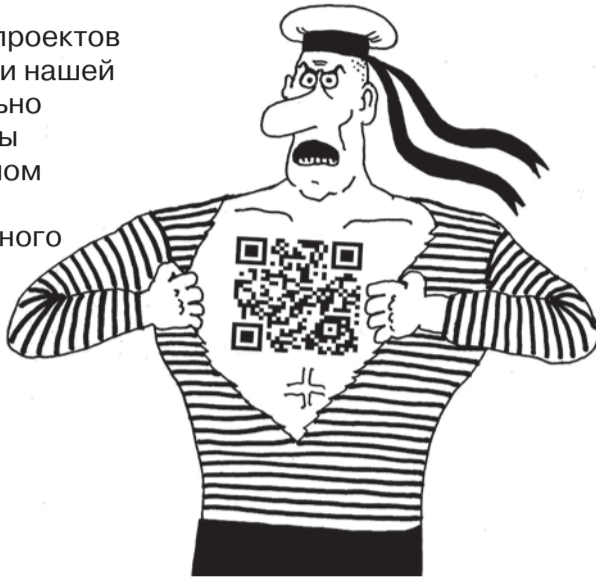
Рис. Валерия Тарасенко, www.cartoonbank.ru