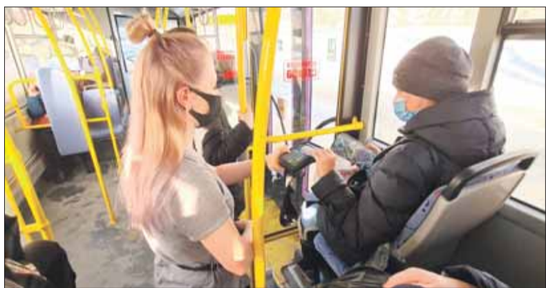
Среди частых нарушений – занижение числа работников. Такая картина особенно характерна для пассажирских перевозок.

В целом в структуре плательщиков НПД больше всего сдающих в аренду жилье, репетиторов и тех, кто предоставляет различные бытовые услуги – к примеру, занимается ремонтом техники. Также среди самозанятых немало водит