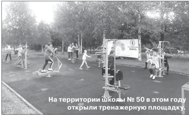
На территории школы № 50 в этом году открыли тренажерную площадку.

Власть и общество: В Архангельске внесены изменения в проект «Бюджет твоих возможностей»