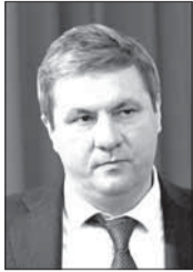
Дмитрий МОРОВ, глава Архангельска:

– Проект предоставил каждому жителю Архангельска возможность реализовать свои идеи по развитию города. Однако последние изменения законодательства вынудили нас несколько пересмотреть принципы инициативного бюджетирования. Наиболее значимое изменение заключается в том, что теперь предлагать и защищать свои идеи в рамках проекта «Бюджет твоих возможностей» граждане могут только коллективно.