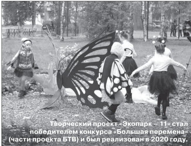
Творческий проект «Экопарк – 11» стал победителем конкурса «Большая перемена» (части проекта БТВ) и был реализован в 2020 году.