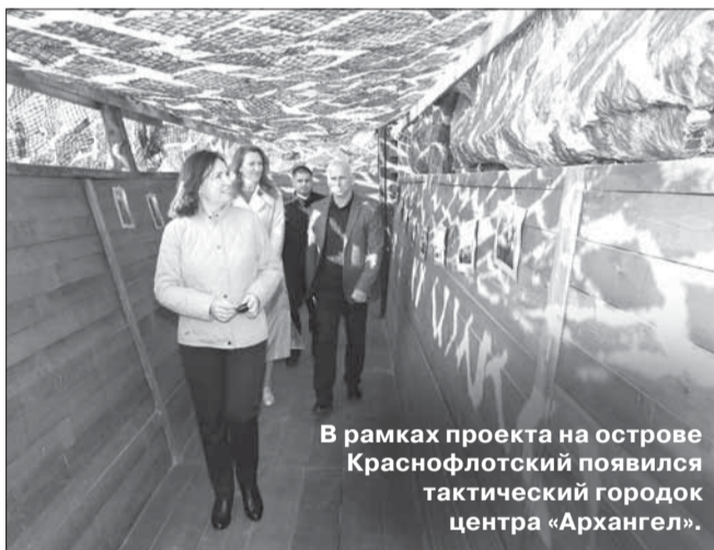
В рамках проекта на острове Краснофлотский появился тактический городок центра «Архангел».