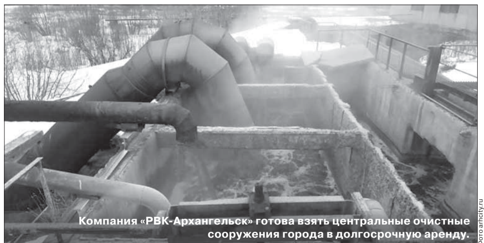
Компания «РВК-Архангельск» готова взять центральные очистные сооружения города в долгосрочную аренду.