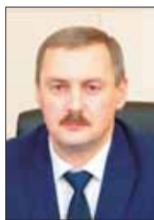
Игорь ГОДЗИШ, глава администрации Архангельска:

– Чтобы получить продолжение пешеходной зоны, нужно обеспечить сквозной проход до Красной пристани. Но со стороны реки это пока невозможно. Поэтому возникла идея сделать это через сквер Дворца детского и юношеского творчества, обустроив его. Это очень востребованное место, но сейчас тротуар здесь очень узкий – двум мамочкам с колясками не разойтись. Мы хотим сделать широкий комфортный бульвар, где можно гулять, кататься на роликах и велосипедах, установить скамейки для отдыха. Учитывая, что это значимая для всего города территория, мы проведем общественное обсуждение, чтобы люди могли высказать свои предложения.