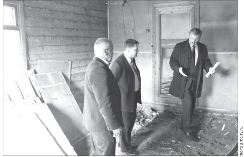
На первом этапе реконструкции лыжной базы будут восстановлены помещения для спортсменов, тренеров и судей: сейчас эти здания в удручающем состоянии.

Как пояснил глава города, работы финансируются за счет средств муниципального бюджета: в ремонт лыжной базы необходимо вложить около 300-400 тысяч рублей. В администрации Архангельска надеются, что в «Сало-