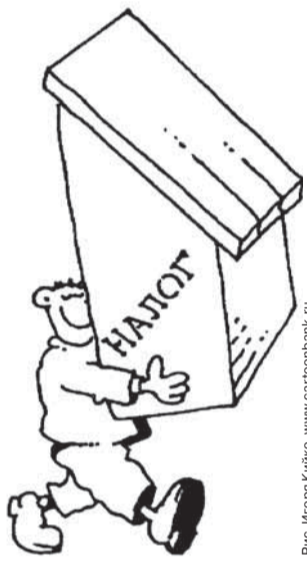
Рис. Игорь Кирилло, www.cartoonbank.ru

ния», – пояснила руководитель ведомства.