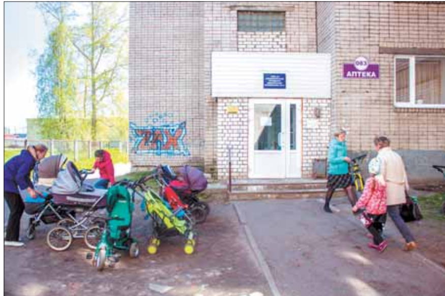
Сейчас жители Майской Горки обращаются за медицинскими услугами в филиал городской поликлиники № 2, расположенный в санатории-профилактории «Родник». Помощь узких специалистов можно получить только в самой поликлинике – на Северодвинской, 16, куда долго добираться на общественном транспорте.

Майская Горка сейчас – пожалуй, самый растущий из округов Архангельска. Но возводить там нужно не только жилые многоэтажки. С увеличением населения округа повышается, в частности, и потребность в получении медицинской помощи недалеко от дома. Необходимость строительства в Майской Горке новой поликлиники возникла еще лет десять назад. Не получив на эти цели средств из бюджета, министерство здравоохранения нашло выход в государственно-частном партнерстве (ГЧП). Инвестор обещает, что центр семейной медицины появится в округе к началу 2020 года.