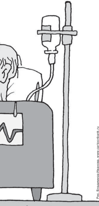
Рис. Владимира Иванова, www.cartoonbank.ru

Догадываться о том, что с эффективностью использования бюджета ТФОМС не все благополучно, многие депутаты начинают только тогда, когда число жалоб от населения по вопросам здравоохранения начинает превышать число жалоб по проблемам ЖКХ.