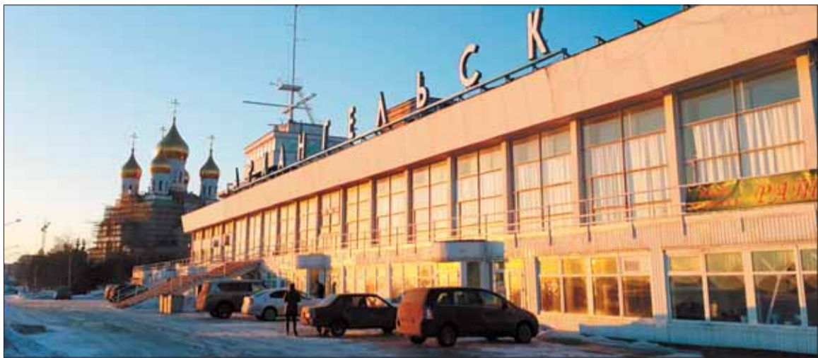
Правительство России решило проводить раз в два года форум именно у нас, значит, город все же стал «арктической столицей». Поднимется ли при этом уровень жизни архангелогородцев?

Ключевую роль в развитии экономики региона, как считают в правительстве области, должна сыграть Архангельская опорная зона, о которой сегодня, наряду с Кольской в Мурманске и Якутской, говорят в Минэконом-