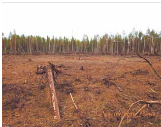
На месте, где был лес, образовалась округлая поляна диаметром около 100 м.

Официальной информации от МЧС и Роскосмоса по поводу случившегося по-прежнему нет. Пресс-служба Космических войск ограничилась заявлением о том, что запусков ракет 25 августа не проводилось. В этот день, напомним, была объявлена внеплановая проверка боеготовности Вооруженных сил России. Она завершилась 31 августа.