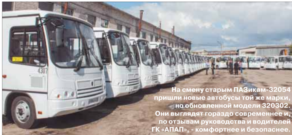
На смену старым ПАЗикам-32054 пришли новые автобусы той же марки, но обновленной модели 320302. Они выглядят гораздо современнее и, по отзывам руководства и водителей ГК «АПАП», - комфортнее и безопаснее.

Одно из крупнейших предприятий на рынке перевозчиков в Архангельске — Группа компаний «АПАП» - закупило 40 новых автобусов. При этом по госпрограмме утилизации из эксплуатации выведено столько же машин старой модели. Новинки уже в городе и проходят процедуру регистрации, а некоторые даже успели выйти на маршруты. В ответ на обновление автопарка перевозчики рассчитывают на встречные шаги со стороны властей, которые создадут бизнесу более комфортные условия и позволят «отбить» затраты.