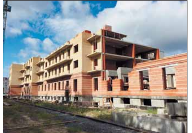
На стройплощадке ЖК «PARUS» полностью завершена нулевой цикл. Ведутся работы по возведению первой очереди жилого комплекса на 217 квартир. Половина из них уже куплена северодвинцами.