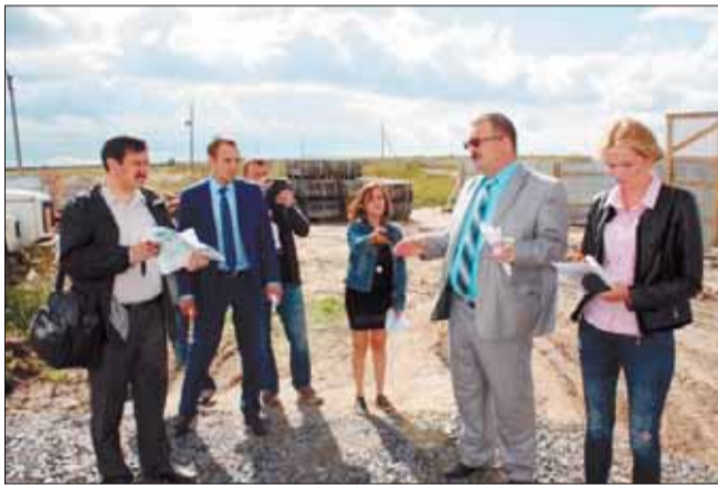
Сдача 1-й очереди ЖК «PARUS» запланирована на 4-й квартал 2017 года. Успешно реализуемый холдингом «Аквилон-Инвест» проект дополнит облик одной из центральных площадей города корабелов.

стыре располагались лишь коммерческие ларьки, да ветер обдавал песком и пылью проходивших через пустырь пешеходов. Успешно реализуемый холдингом «Аквилон-Инвест» проект комплексного решения застройки данного участка не просто «замкнет круг» в едином архитектурном стиле, но и будет способствовать созданию в Северодвинске новых прогрессивных форматов современных общественных пространств.