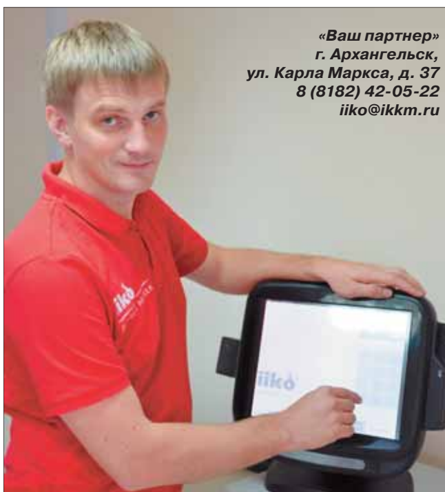
«Ваш партнер» г. Архангельск, ул. Карла Маркса, д. 37 8 (8182) 42-05-22 iiiko@ikkm.ru

- В Архангельске мы внедрили iiiko более чем в 50 точках общепита, и владельцы быстро оценили скорость и качество ее работы. Настройка уведомлений позволяет предпринимателю контролировать персонал, выручку, закупку продуктов, не выходя из дома или находясь в отъезде. Вся информация представлена наглядно и отображается в режиме онлайн на телефоне, планшете или стационарном компьютере.