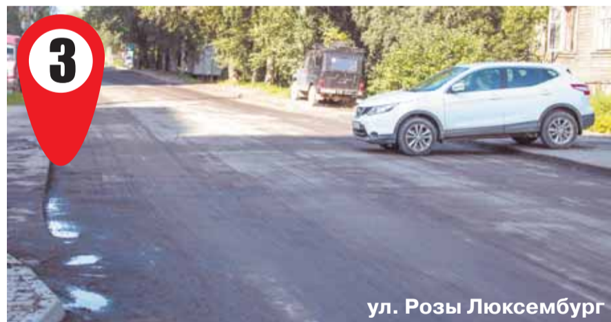
ул. Розы Люксембург