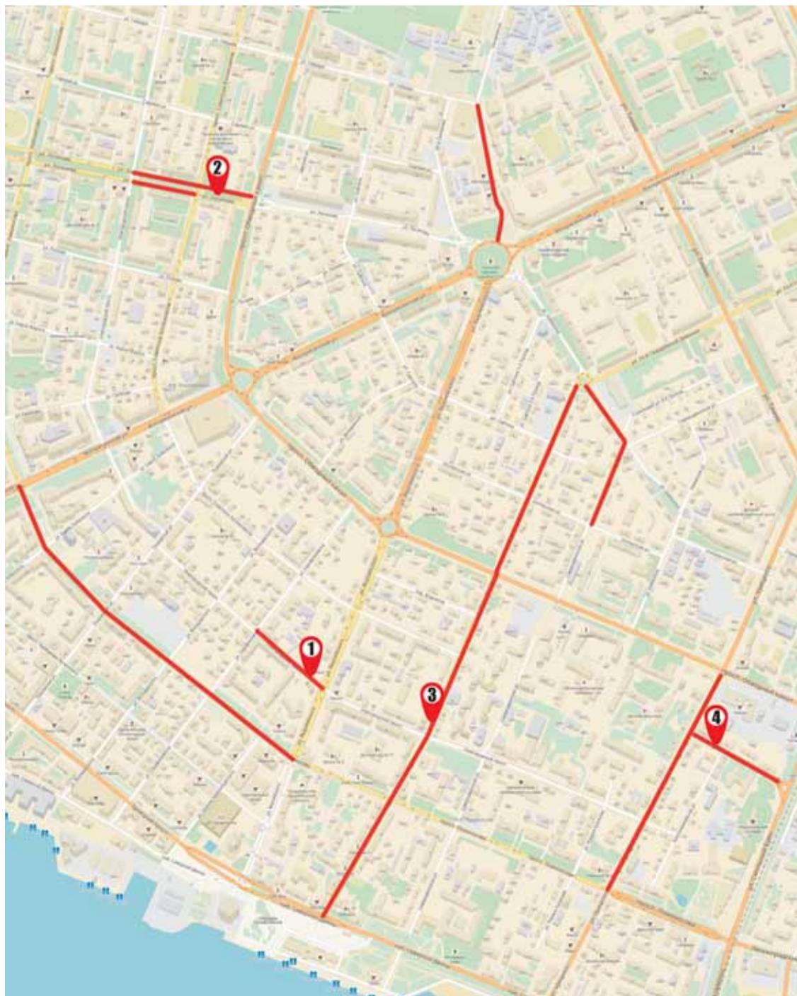
Карта ремонта дорог в г. Архангельске в 2016 году (центр города)

Помимо ремонта дорог, большое внимание будет уделено приведению в порядок тротуаров, а также памятных мест Архангельска. В рамках проведения мероприятий, посвященных 75-летию прихода первого союзного конвоя «Дервиш», на сумму более 10 млн рублей будет выполнено устройство пешеходных дорожек на центральных улицах города, запланированы перекладка брусчатки возле обелиска Жертвам интервенции на Севере, ремонт памятника Юнгам Северного флота (как самой статуи, так и фундамента).