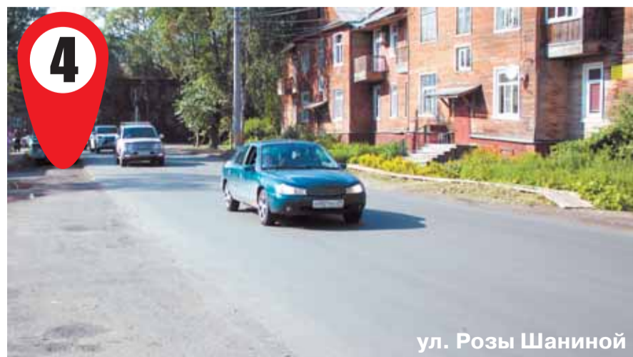
ул. Розы Шаниной