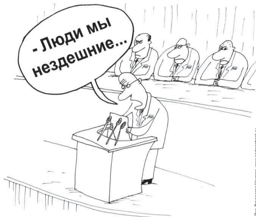
Рис. Вячеслава Шилова, www.cartoonbank.ru

ем комментарии отметил другой важный аспект проблемы – образовательный.