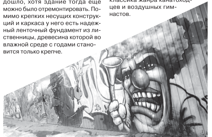
Современные архангельские подростки и молодежь все же скучают по цирку – пусть и выражают это в своем стиле.

Новый культурный объект – это здорово, но едва ли у архитекторов и строителей получится цирк. По всем канонам такие зрелищные заведения стоят исключительно в центре города или на оживленных ярмарочных площадях. Цирк – это массовое искусство, доступное не только для обеспеченных горожан, и место, где должны продаваться дешевые билеты. Весь секрет исключительной доходности был скрыт в огромной посещаемости удачно установленного балагана, то есть в логистике – так называется теперь наука, которой интуитивно владели антрепренеры далекого прошлого. Архитектурные особенности цирков могут существенно различаться, но есть две константы, которые соблюдаются в цирковой индустрии всего мира. Первая – диаметр арены: ровно 13 метров – именно такой параметр обеспечивает бег лошадей в полном галопе по ровному кругу. Вторая – высота купола над уровнем манежа: ровно 18 метров, это классика жанра канатоходцев и воздушных гимнастов.