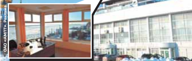
ОАО «АМТТ», Реклама