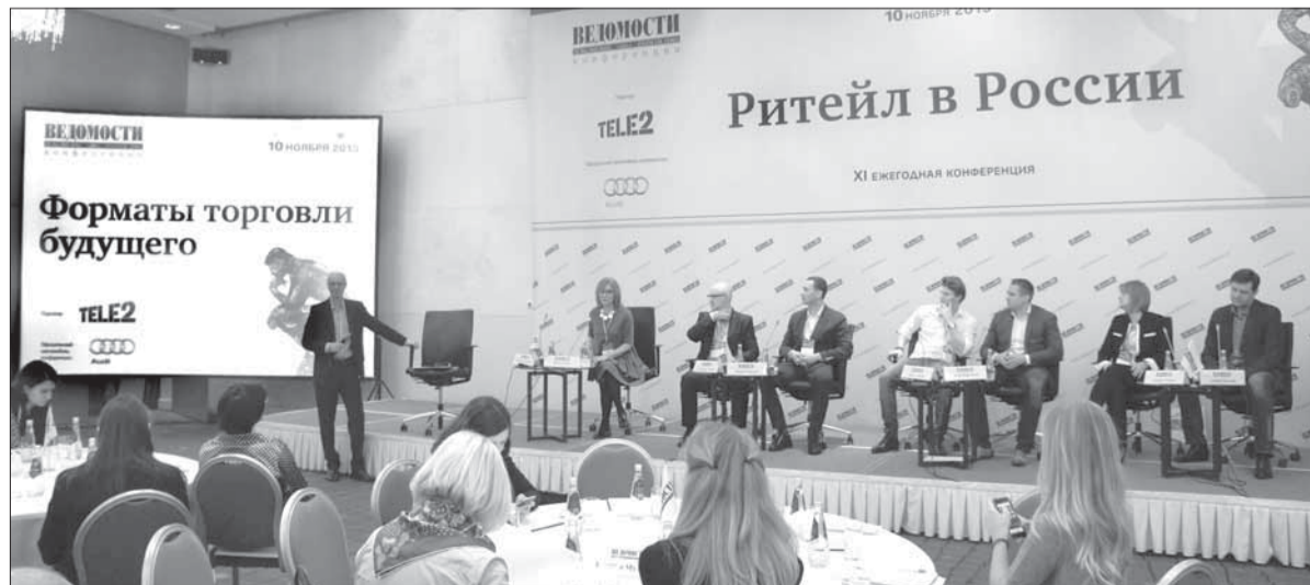
В кризис профессионалы советуют опираться на «вечные ценности» и думать о том, что для потребителя будет одинаково важно и через год, и через 10 лет.

В следующем году оператор планирует подключить более 5 млн абонентов только в Москве и Московской области. Москва – наиболее маргинальный город, ответных действий со стороны конкурентов по рынку не может не быть: некоторые снизили цены на 20-30%.