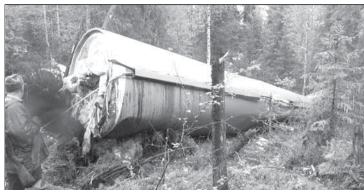
Одна из проблем, решение которой сдвинулось с места благодаря участию Общественной палаты, - уборка «космического мусора» - частей ракет, запускаемых с космодрома Плесецк.

– Совместно мы искали пути разрешения проблем, которые существуют в обществе. Не было случая, чтобы наши обращения в правительство оставались без ответа. Мы не преходящий тренд - мы надолго. Потому что пока не будет формироваться активная позиция общества, проблемы останутся проблемами. За три года мы создали хорошую базу, чтобы преемники сосредоточились на практической работе, а не занимались оргвопросами.