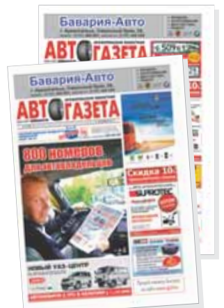
ООО «ИМИДЖ-ПРЕСС» - Регистр.

20 лет автомобилисты Архангельской области начинают рабочую неделю с еженедельника «АВТОгазета»